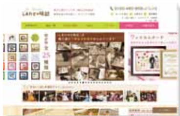
しあわせの時計 トップ画面

平成16年にはしあわせの時計という名称の商標登録も行いました。また、平成18年には府中商工会議所60周年記念式典で新事業アワードの新規創業部門の優秀賞で表彰もされました。このことを府中けいざい情報に掲載するなどの広報活動にも力を入れたところ様々なメディアにしあわせの時計が紹介され売上げも順調に推移しました。